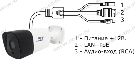
Рис.1 Схема подключения видеокамеры